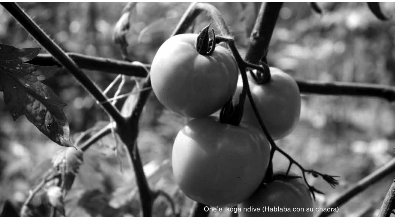
Oñe'e ikóga ndive (Habla con su chacra)