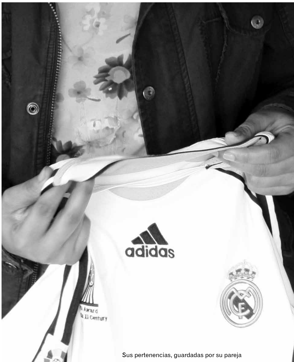
Sus pertenencias, guardadas por su pareja